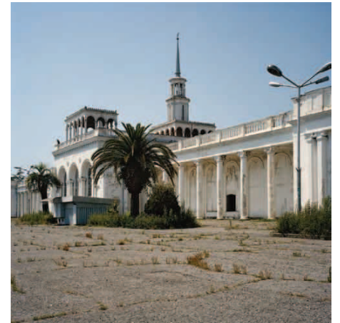
Gare ferroviaire de Soukhoumi (Abkhazie) , 2006

Voilà dix ans que je parcours les ex-Républiques soviétiques. Russie, Asie Centrale, Caucase, Europe de l'Est, quelles que soient les thématiques que j'ai pu aborder dans ces pays, mon travail photographique a une portée documentaire mais plus subjectivement parle de la perte et de l'abandon. Depuis la fin de l'Union Soviétique, peu de ces anciennes républiques sont parvenues à trouver un modèle social, économique et politique stable. Un bien lourd héritage pèse sur leurs épaules, source de conflits, de catastrophes écologiques et de dépendance vis-à-vis de la Russie. Mes images parlent de cela à travers la simple rencontre de réfugiés oubliés ou de pêcheurs qui ne pêchent plus. La nostalgie qu'elles expriment parfois à travers des lieux abandonnés ou d'un autre temps est sans doute celle dont les gens là-bas sont empreints face aux difficultés qu'ils vivent au quotidien. De fait la problématique de ce travail s'attache davantage à montrer « ces mondes en voie de disparition » plutôt que ce qui en renaîtra.