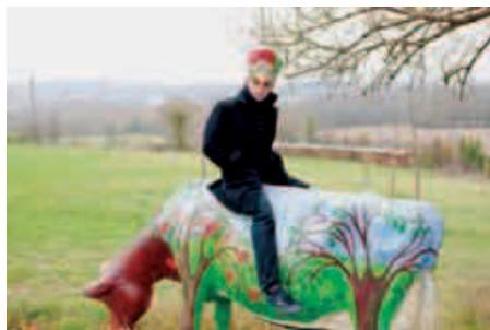
Another Country

Une œuvre personnelle et documentaire sur la réalité et les fantasmes des Britanniques expatriés en France.