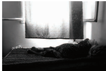
© Halida Boughriet : Mémoire dans l'oubli , 2011 (tirage numérique 150x100)

Les événements d'Algérie, comme on les appelait honteusement en France, sont rarement abordés par le prisme du rôle des femmes qui ont pourtant participé, au même titre que leurs défunts maris, à « l'effort », en résistant, en combattant, en souffrant, en renouvelant aussi un modèle familial. Elles sont les derniers témoins vivants d'une guerre « sans nom » qui laisse encore mal à l'aise beaucoup de ses protagonistes.