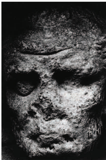
© Marie-Christine Schrijen : Le penseur, 2008

Le thème du fantastique se trouve ici représenté dans ces faces de pierre qui interrogent le passage du temps. Le tirage, longue opération manuelle, accentue certains traits et en fait disparaître d'autres. Il aplatit certains reliefs ou les accuse en une série d'opérations toutes orientées vers la révélation d'un caractère soit comique, soit tragique, en tout cas questionnant. Ce point de vue du photographe puise dans un fonds accumulé au cours des années et qui s'affine grâce à une recherche constante.