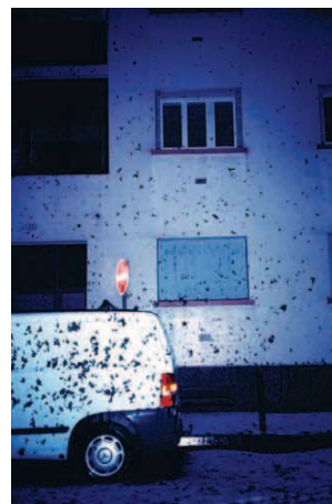
© Gaël Bonnefon : L'entraînement, 2009

[...] Ce qui d'emblée berce l'œil dans le travail photographique de Gaël Bonnefon, c'est cette persistance d'une lumière déclinante, son jeu de clairs-obscurs et de flashes, ses ciels laiteux et ses couleurs saturées à bloc.