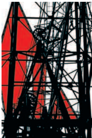
Grues XI Triage numérique peint

Martine Mougin, photographe-plasticienne, nourrit une passion peu commune pour les paysages industriels, et en particulier pour les architectures portuaires, dans lesquels containers, grues et portiques, citernes, ponts mobiles ou jetées métalliques s'entremêlent dans un ballet perpétuel et fascinant, lourd et fluide à la fois. Ses photographies rehaussées d'encres colorées ou rendues en noir et blanc graphique, sont le résultat d'une longue résidence à Rotterdam, notamment à la Foundation Mirta Demare, en 2008, complété par des clichés pris sur les ports du Havre et de Barcelone.